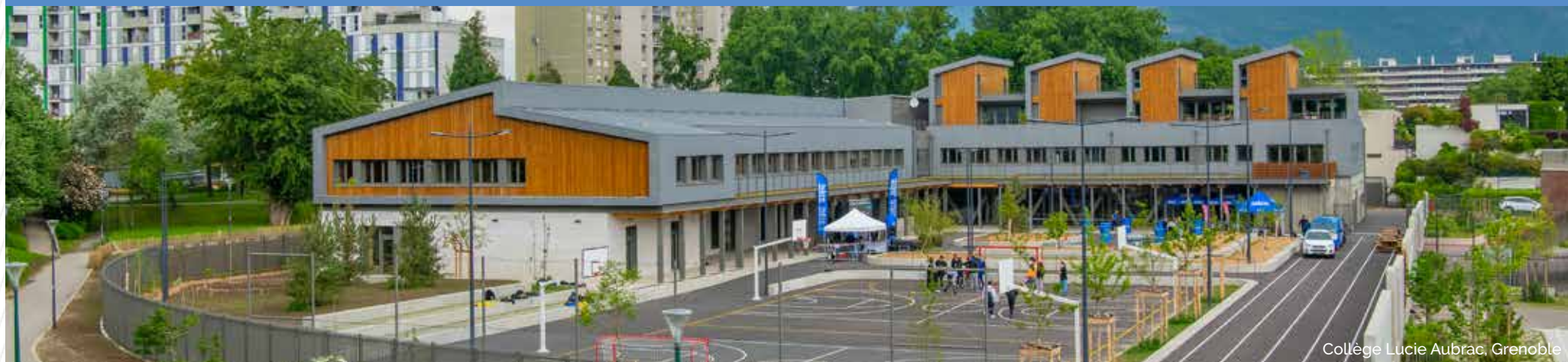
Collège Lucie Aubrac, Grenoble