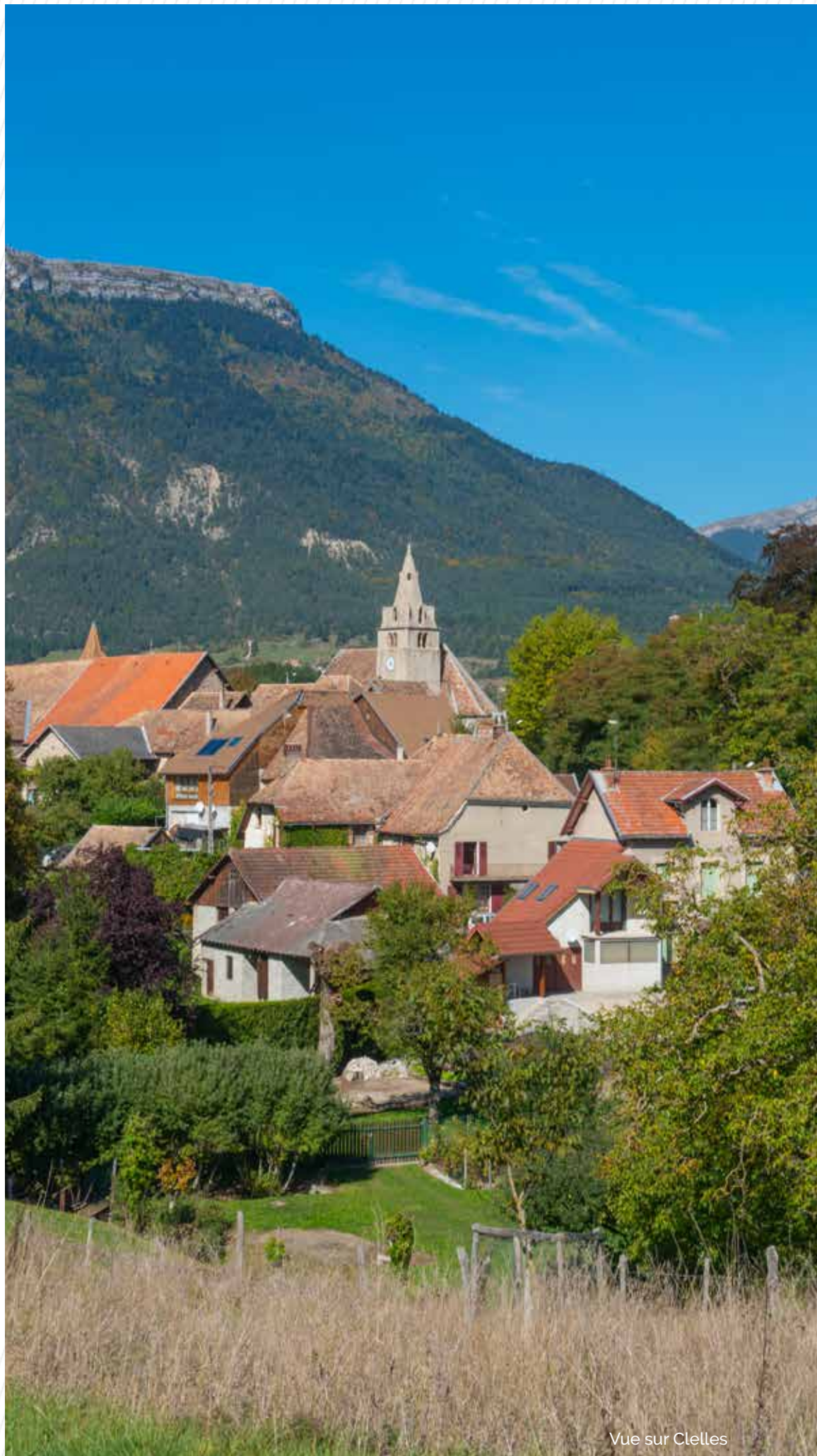
Vue sur Clelles