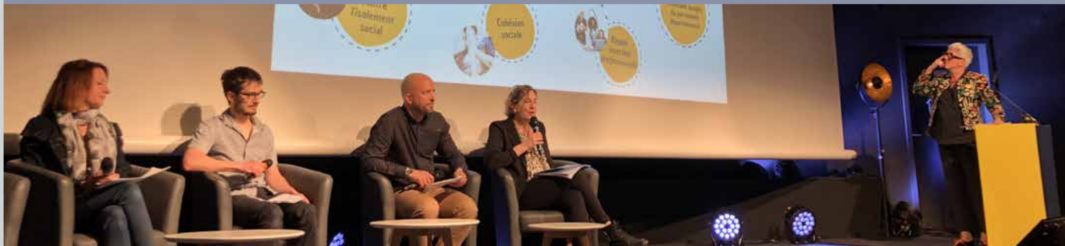
Lancement du PADI - Alpexpo