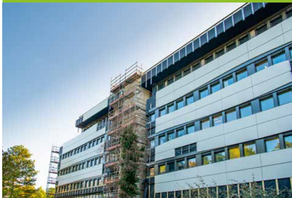
Travaux d'écocémentation - Hôtel du Département, Grenoble

La nécessaire exemplarité du Département en matière de réduction des émissions de gaz à effet de serre flèche des actions structurantes pour l'ensemble de ses services comme les politiques d'achat durable, la sensibilisation de ses agents.