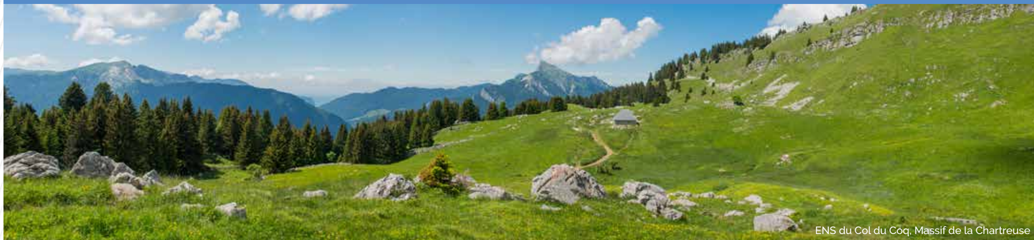
ENS du Col du Coq, Massif de la Chartreuse