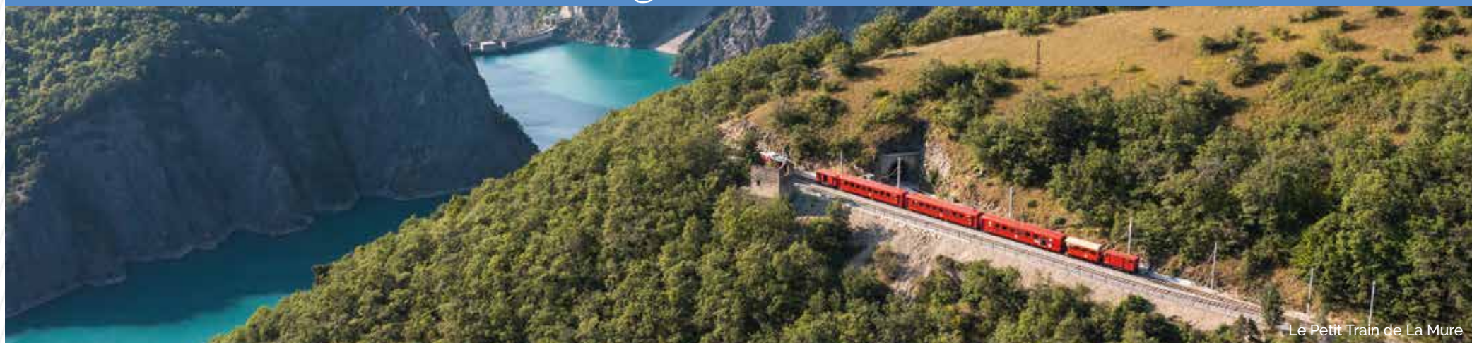
Le Petit Train de La Mure