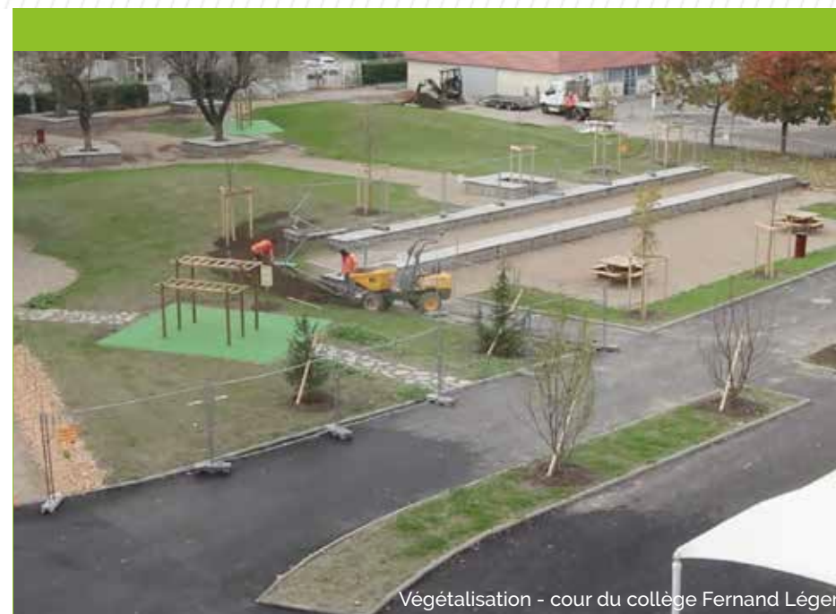
Végétalisation - cour du collège Fernand Léger

Partenaire essentiel des communes et des EPCI, le Département offre aux collectivités et aux particuliers des solutions pour agir et lutter concrètement contre le changement climatique. Ainsi, plusieurs dispositifs intégrant des leviers d'action différents : financiers, d'ingénierie territoriale, d'expertise... sont proposés pour engager la rénovation thermique, développer les énergies renouvelables, créer des réseaux de chaleur ou développer des îlots de fraîcheur. Ils ont pour but d'atténuer les émissions de CO 2 sur le territoire, de moins dépendre des énergies fossiles et donc de faire des économies, et de faciliter l'adaptation des habitants au changement climatique.