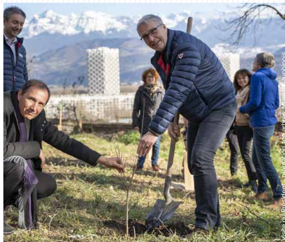
Visite du Président - plantation 300 arbres, Musée Dauphinois

Pour soutenir les communes et les Établissements publics de coopération intercommunale (EPCI) et leur permettre de viser un haut niveau de performance énergétique dans leurs projets de rénovation de bâtiments, le Département a voté en 2022 la mise en place d'une subvention incitative. Ainsi une bonification de 10 % sur le montant total hors taxe des travaux en maîtrise d'ouvrage communale ou intercommunale pour des projets de rénovation, restructuration, réhabilitation ou changements de destination des bâtiments existants sera attribuée en complément de la dotation territoriale. Cette subvention plafonnée à 100 000 € par projet, est attribuée sous réserve que les travaux permettent d'atteindre un gain énergétique théorique de -40 % en énergie finale. Chaque commune peut déposer jusqu'à deux projets par an pendant 3 ans.